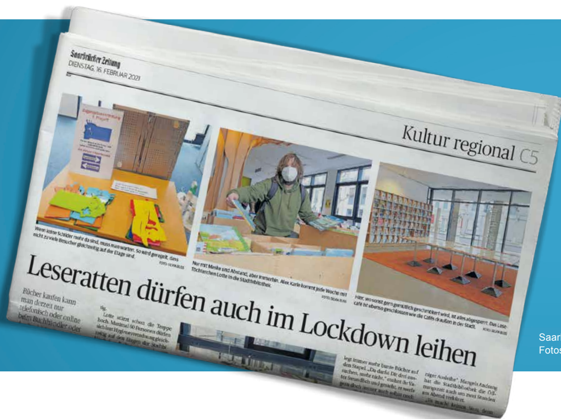
Saarbrücker Zeitung, Fotos © Silvia Buss