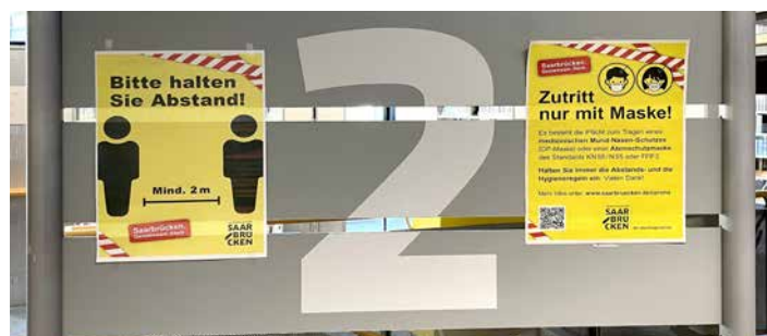
Beschilderung Corona-Regeln in der Stadtbibliothek

Ab August 2021 wurden auf Grundlage eines umfassenden Hygienekonzepts wieder vermehrt Präsenzveranstaltungen angeboten und Aufenthaltsmöglichkeiten in der Bibliothek geschaffen. Zur Optimierung der Hygienebedingungen investierte die Bibliothek in ein Luftreinigungsgerät. Unter Berücksichtigung von Abstandsregelungen konnten etwa 20 Lese- und Arbeitsplätze freigeben und Veranstaltungen mit maximal 15 Personen durchgeführt werden. Alle Angebote wurden durch die Bibliotheksnutzenden sehr gut angenommen, wengleich aufgrund der Hygienebestimmungen nur eine sehr reduzierte Auslastung möglich war. Das zeigt sich auch deutlich in der Nutzungsstatik. So haben sich die Besuchszahlen von über 1.000 Besuchen pro Tag seit der Pandemie um etwa zwei Drittel reduziert. Erfreulich ist, dass die Ausleihzahlen gegenüber dem Vorjahr wieder leicht gestiegen sind (+ 5 %). Positiv ist auch die Entwicklung der virtuellen Bibliotheksangebote: Die Reichweite des Facebook-Kanals konnte gesteigert werden und auch die Webseite der Stadtbibliothek erfreute sich starker Nachfrage (rund 140.000 Seitenaufrufe).