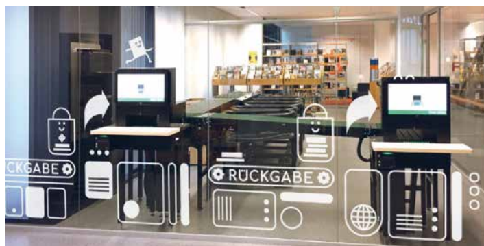
Neue Beklebung im Eingangsbereich

Die erste Jahreshälfte 2021 war geprägt durch die verschärften Corona-Maßnahmen ab Dezember 2020. In den ersten fünf Monaten mussten die Öffnungszeiten aufgrund von rollierenden Teams um zwei Stunden pro Tag reduziert werden. Präsenzveranstaltungen waren aufgrund der Hygienebestimmungen nicht möglich und die über 200 Lese- und Arbeitsplätze waren für die Nutzung gesperrt.