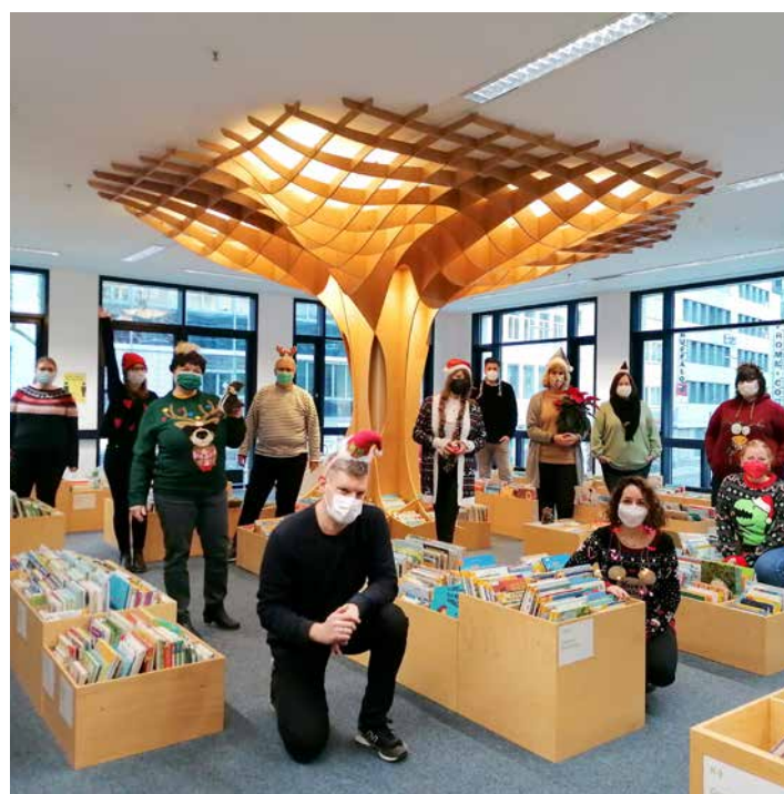
Das Team der Stadtbibliothek im Advent 2021

Ab der zweiten Jahreshälfte wurden wieder Präsenzführungen in den Räumen der Stadtbibliothek angeboten: beispielsweise Bibliothekstouren für Kitas und Schulklassen und eine Einführung für Bedienstete der Landeshauptstadt. Insgesamt 126 Personen wurden erreicht.